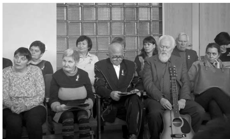
Dvidešimtmečiui skirtame poezijos vakare dalyvavo visų Aknystos socialinės globos namų skyrių atstovai.

Aknystos socialinės globos centruose namuose bei Šlavėnų,