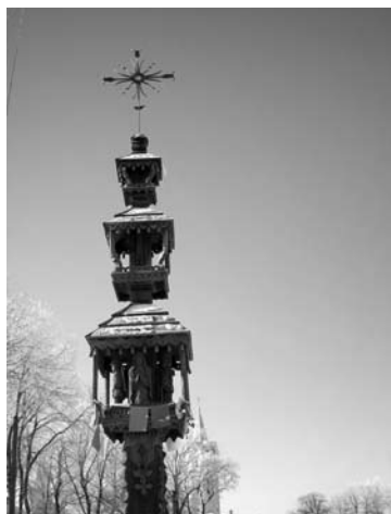
Vietoj sovietų sunaikintojo, svėdasiškiai 1989 m. vasarą atstatė tokį koplytstulpį.