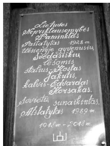
Koplytstulpio istoriją įprasminanti lentutė pritvirtinta šiemet.