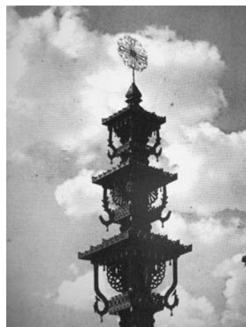
Nepriklausomybės sodelyje 1928 m. pastatytas koplytstulpis.

Kuomet mūsų Tėvynės Lietuvos nepriklausomybei stuktėlėjo 10 metų, Svėdasuose, Nepriklausomybės sodelyje, ta proga buvo pastatytas koplytstulpis. Jį dovanojo Amerikoje gyvenantys kraštiečiai. Sovietmečiu paminklas buvo sunaikintas, o Atgimimo metais atstatytas kiek kitoks ir kitoje vietoje.