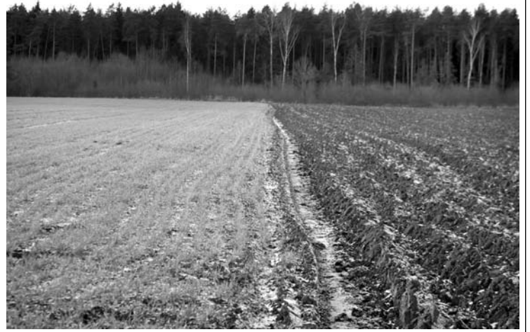
Pasėlius ir augalus nuo rizikų, susijusių su meteorologiniais reiškiniais, 2017 m. draudė 671 ūkis. Apdraustas plotas siekė 201 tūkst. ha.

Prieš teikdamas paraišką mінėtajai paramai gauti, pareiškėjas su draudimo bendrove turi pasirašyti draudimo sutartį/draudimo paraišką ne ilgesniam